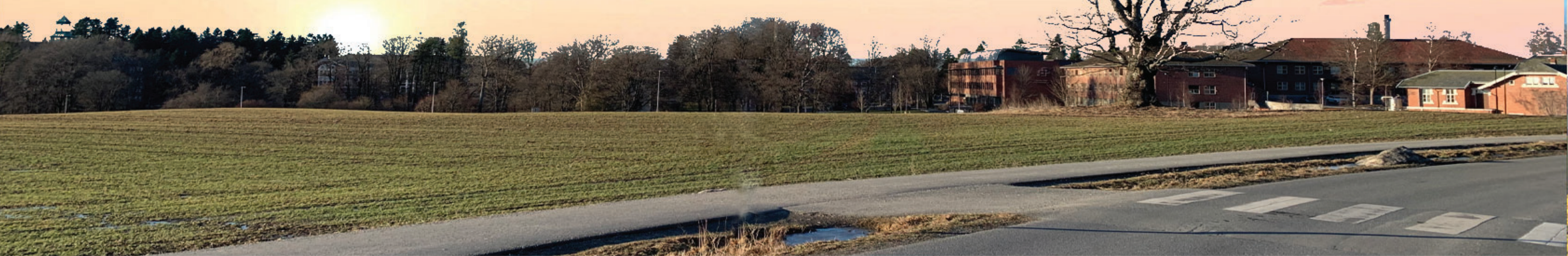
DAGENS SITUASJON (FØR-BILDE)

Gatehjørnene rundt meierikrysset oppleves i dag som et episenter for uformelle, spontane og ikke-planlagte møter. Likevel ønsker vi å utvikle dette møtepunktet på en annen nærliggende plass, som er bedre skjermet mot støy fra trafikken, og samtidig har bedre utsiktsforhold over jordet, og solnedgangen med nærhet til Eika. Det eldgamle treet står der fortsatt - frisk og vakker - år etter år, og minner oss på at det vil komme en tid etter denne pandemien, der tilværelsen blir mer normal igjen.