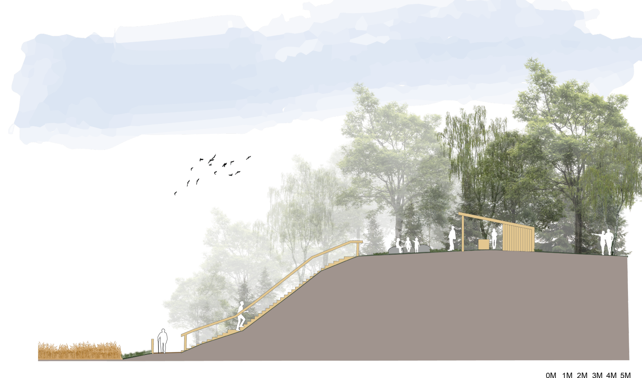
Oppriss CC: Høyden med utkikkspunkt over Vestbygda og Mjøsa.

For at flest mulig skal få gleden av Betsybakken åkerpark anlegges en universelt utformet grussti som er omtrent 550 meter lang. Et sykehjem grenser til prosjektområdet, og vi ønsker at åkerparken skal være tilgjengelig for beboere og besøkende. Grusstien har et gjerde man kan støtte seg til og som gjør at man ikke trækker i åkeren. Stien går helt ut til dammen og har benker hver 100 meter for de som trenger en pust i bakken. Fra grusstien går en trapp opp til et utkikkspunkt med gapahuk og ulike sittemuligheter. Større og mindre oppholdssteder i åkerparken gjør at man kan finne roen og ny giv ute i naturen, enten sammen eller alene.