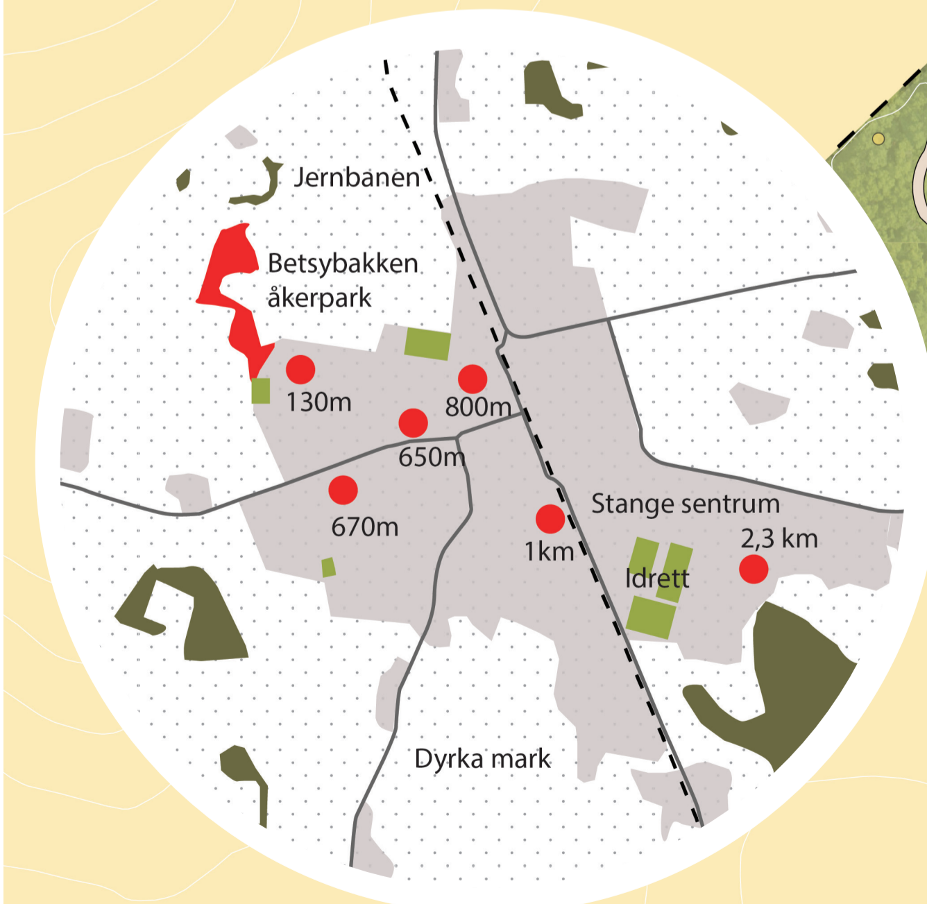
● Barnehager, skoler og sykehjem og gangavstand til Betsybakken åkerpark