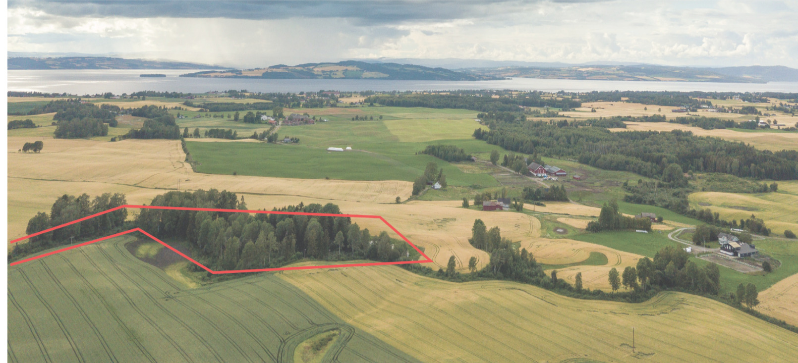
Ekisterende situasjon: utsikt mot Mjøsa med den nordligste delen av prosjektområdet i forgrunnen. Dammen ved skogsholdtet kan skimtes midt i bildet.

Bevegelsesmønsteret til de aller fleste endret seg etter pandemien som kom i 2020. I kortere eller lengre perioder mistet man veien til og fra jobb og skole, avstanden mellom kontor og lunsjsted ble forkortet til noen meter hjemme, og når man skulle begrense sosial kontakt ble det mer og mer skjermbruk. I en slik situasjon blir de korte turene ekstra viktig! Da er det viktig å skape tydelige turstier med fine delmål og rasteplasser, som er tilgjengelig for både unge og eldre. Det er dette vi vil oppnå med vårt prosjekt Betsybakken åkerpark.