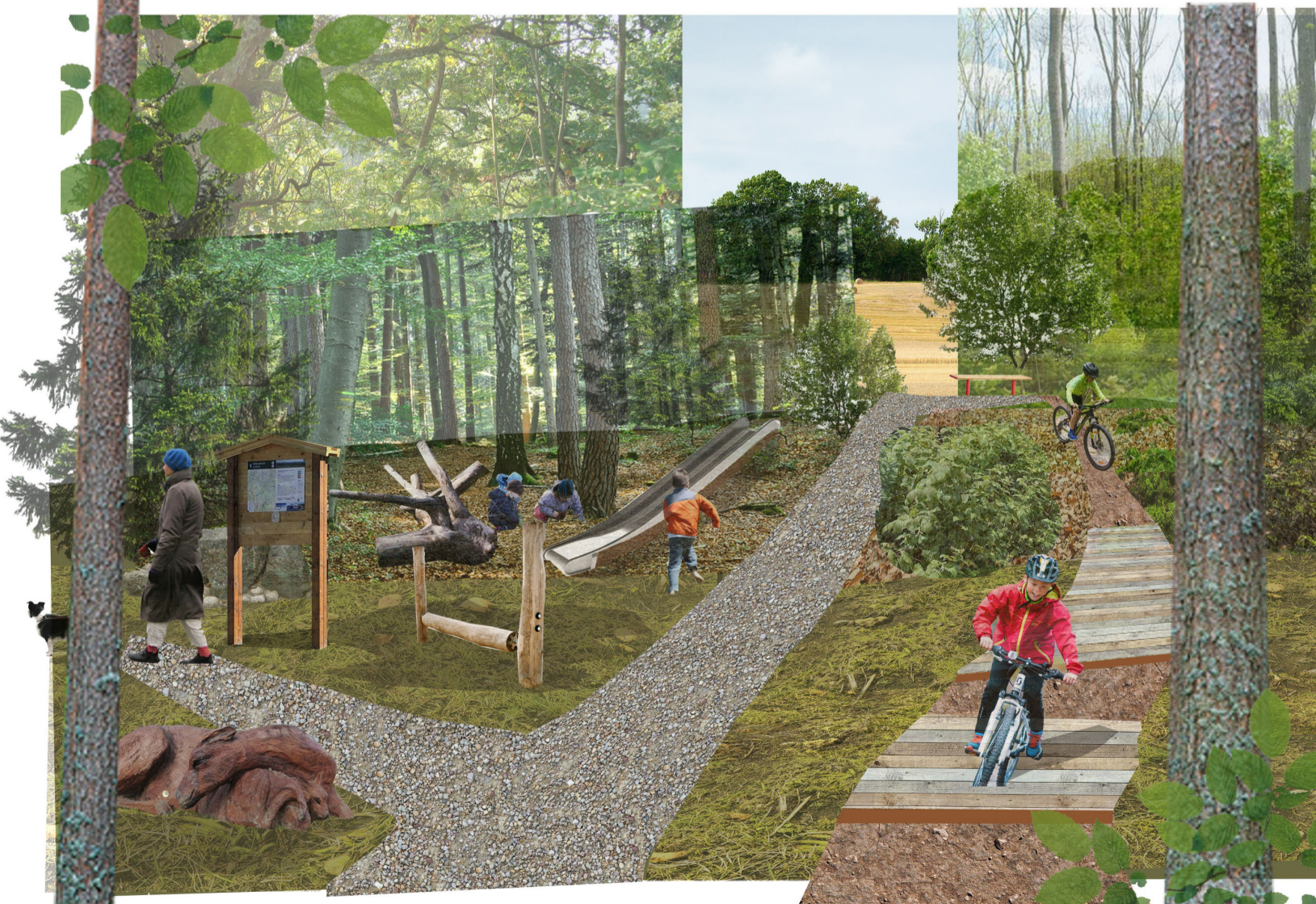
Perspektiv B: Stemningen i aktivitetsskogen og sykkelløypa med smal sti som brukes til sykkelløype, lekeelementer i naturmaterialer og informasjonsskilt om naturen på stedet.

Skogholdet har et kupert terreng som kan gjøre det spennende å sykle eller kjøre på ski i bakkene. Ved å anlegge en sti med hopp og baner i treverk vil det bli morsomt å utforske egne evner i de snille bakkene. Vi ser også for oss at i et område av skogen vil det være lekeelementer som vekker undring, slik som skulpturer og konstruksjoner i naturmateriale man kan gjemme seg i, gå opp på og klatre på. Barn som har vært på området med skolen vil seinere kunne ha lettere for å ta området i bruk og utforske den lille skogen alene, i god avstand fra trafikk.