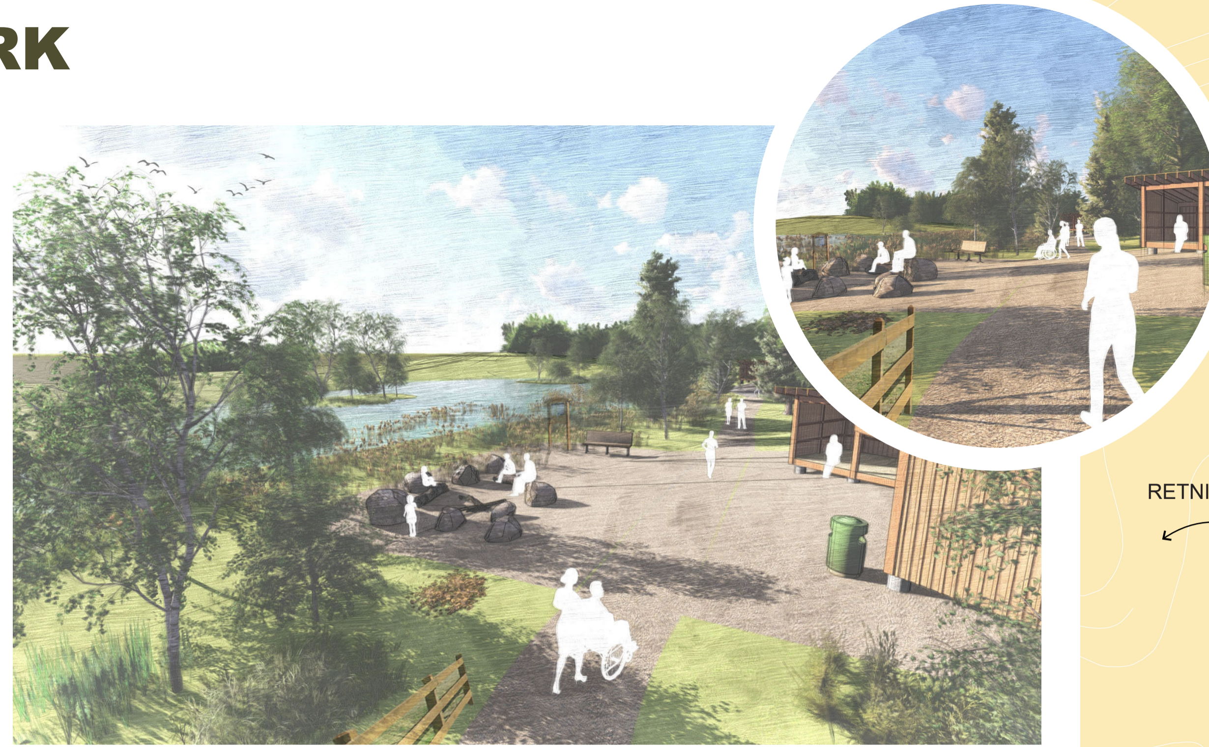
Perspektiv A: Tenkt fremtidig situasjon ved åkerdammen med universelt utformet sti, gapahuk, bål plass, skilt og benker.